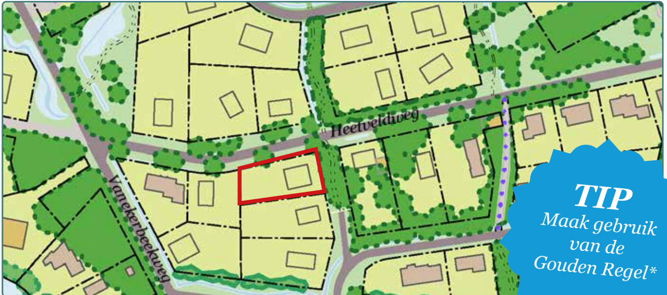
Situatietekening kavel 148