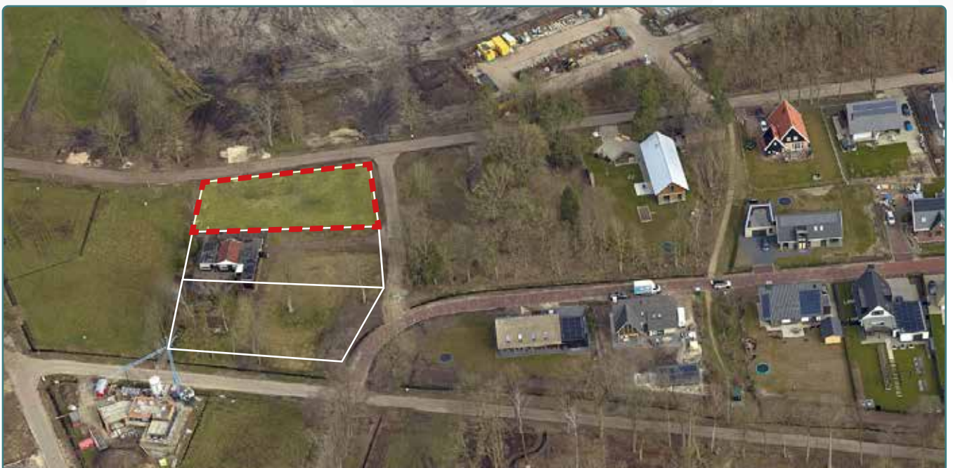
Kavel 148 vanuit de lucht